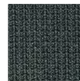
* Ribbstickad, endast i AD